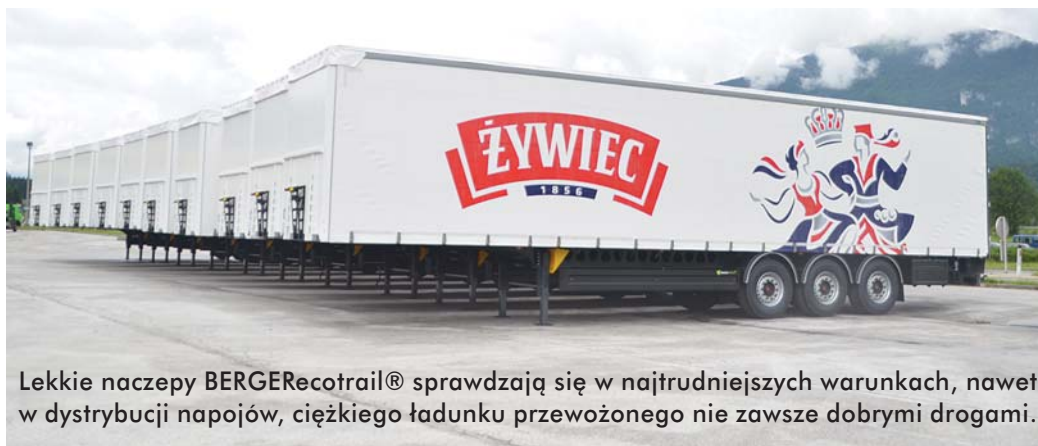
Lekkie naczepy BERGERecotrail® sprawdzają się w najtrudniejszych warunkach, nawet w dystrybucji napojów, ciężkiego ładunku przewożonego nie zawsze dobrymi drogami.

Masa własna standardowej „firanki” 4740 kg wzbudzała niedowierzanie, tym bardziej, iż producent podawał masę naczepy z kołami stalowymi, a nie aluminiowymi, gotową do jazdy i z certyfikatem XL. Cena również stanowiła pewne zaskoczenie, gdyż była nieco wyższa niż zwykłych naczep, oferowanych przez innych producentów. Po 5 latach można powiedzieć, że lekkie naczepy na dobre wpięły się w polski krajobraz transportowy. Obecnie producent znajduje tutaj zbyt dla 20-25% produkcji, a pod względem liczby sprzedanych naczep dorównuje lub nawet przewyższa inne marki obecne w Polsce od wielu lat. Wraz z rozwojem sprze-